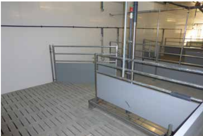
Mastbucht mit Trogtrennwand als Sortierhilfe und Selektionsgitter hinter dem Trog