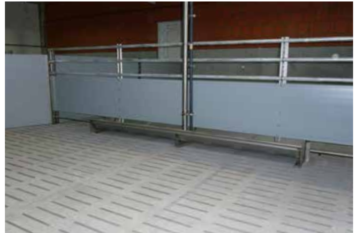
Buchten-Trogtrennwand 50 cm geschlossen und 3 verz. Rohre 1" DIN 2420