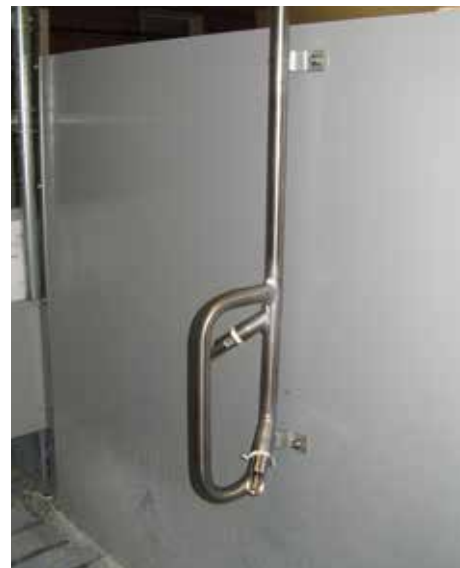
Doppeltränkehalter mit Schutzbügel