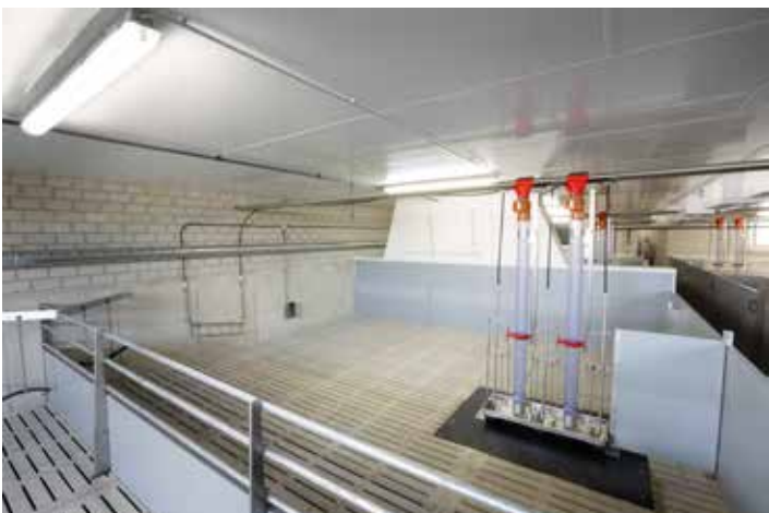
Stallabteil mit Unterflurabsaugung