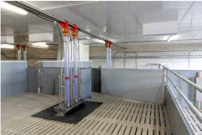
Mastbucht mit Rohr-Doppelautomaten Tube-O-Mat und rutschhemmenden Schutzmatte für den Betonspaltenboden