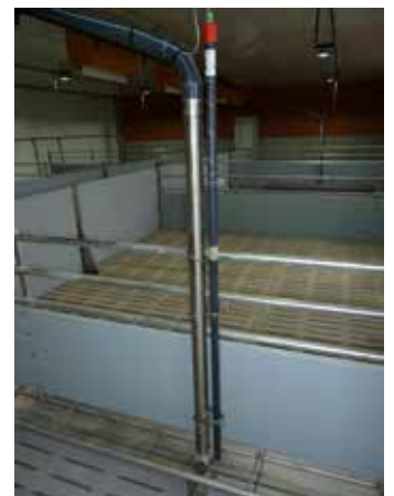
V2A Ablaufrohr mit Halterung für Trogsonde