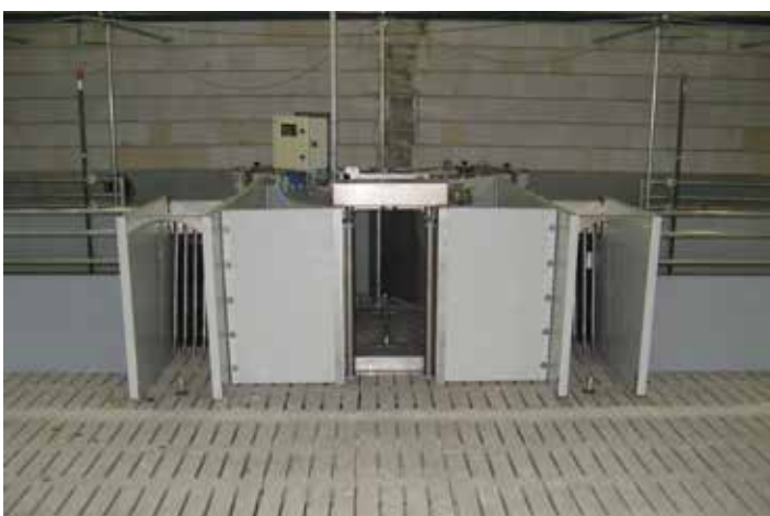
Großbucht für 300 Tiere mit Skiold Sortierwaage und Rückkluftüren im Fressbereich