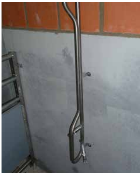
Doppeltränkehalter mit Schutzbügel und Zirkulation

Zur optimalen Versorgung Ihrer Schweine mit Trinkwasser bieten wir für jeden Betrieb die richtige Lösung. Neben verschiedenen Edelstahlhaltern für Tränkenippel haben wir auch wassersparende Tränkebecken im Programm. Wir liefern Rohrleitungen in V2A, PE oder PVC als zentrale Versorgungsleitungen oder als Zuleitung zu den einzelnen Tränken. Außerdem bieten wir individuelle Lösungen für arbeitszeitsparende Einweicheanlagen.