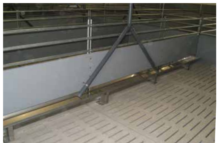
V2A Doppeltrog für rationierte Fütterung mit Tier : Fressplatzverhältnis 1:1