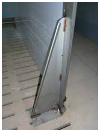
Deltaposten am feststehenden Element