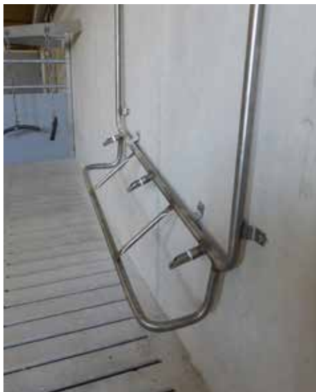
3-fach Tränkehalter mit Schutzbügel und Zirkulation