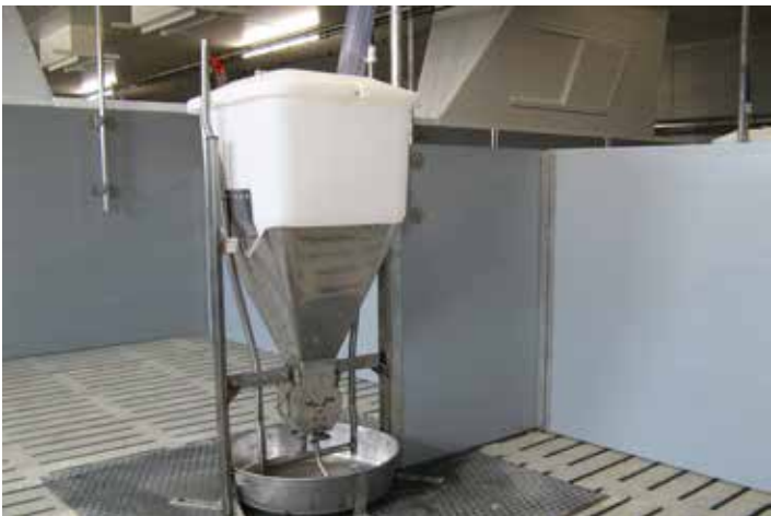
Breiautomat DOMINO Star Feeder mit 80 l Tichter