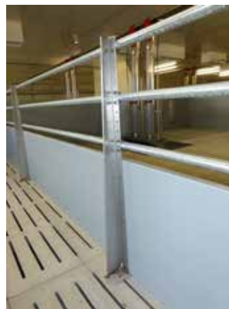
Aussteifungspfosten in Buchtentrennwand