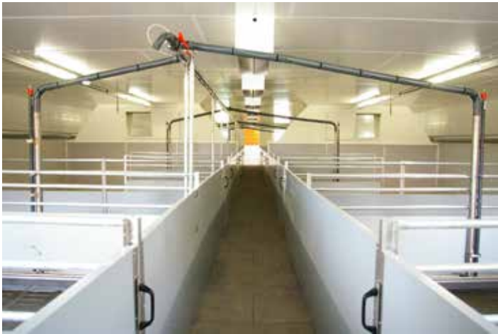
Stallenteil für Schlitzlüftung mit 100 cm geschlossenen Toren und feststehenden Elementen