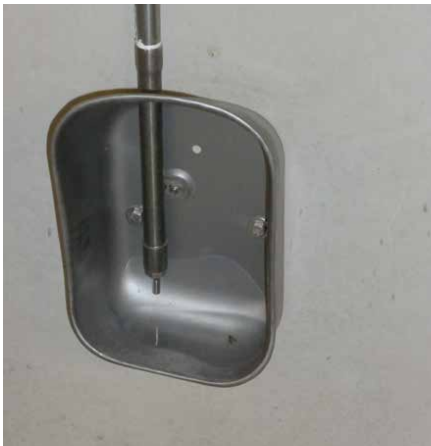
V2A Tränkebecken nach Vorgaben der Tierwohl Richtlinien