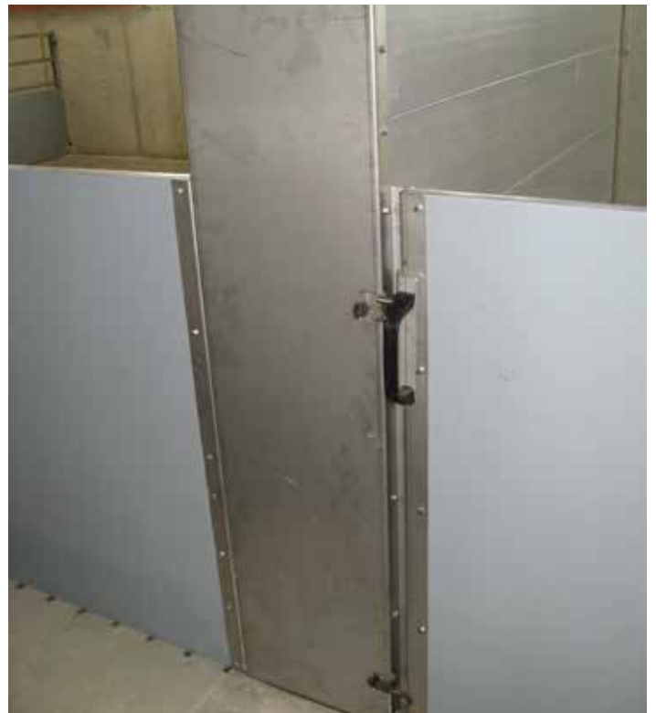
Luftkanal für Unterflurabsaugung mit V2A Kopfblech und integrierter Toraufhängung