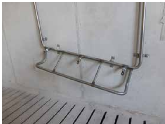
3-fach Tränkehalter mit unterschiedlichen Tränkehöhen