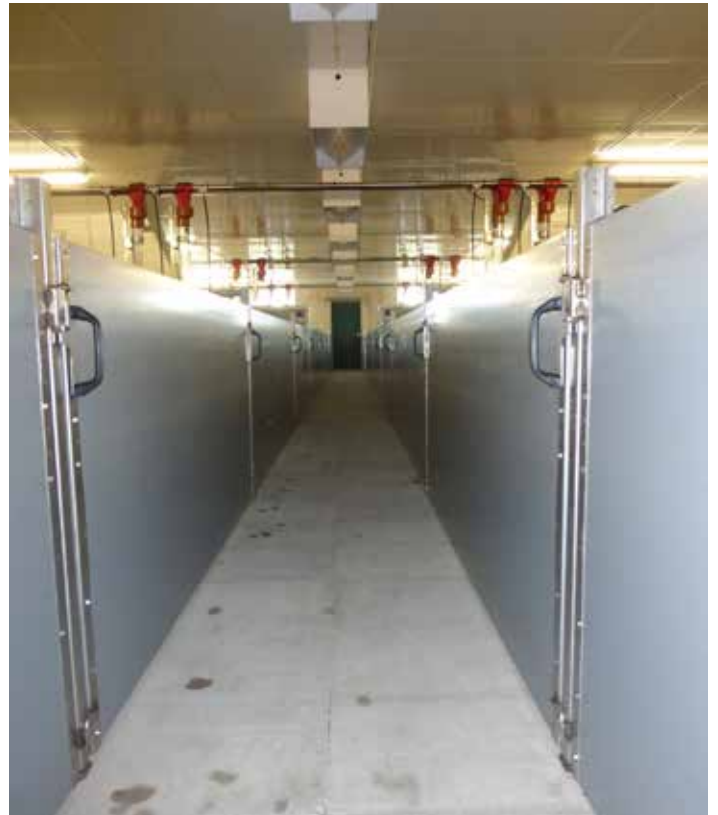
Treibgang mit ergonomischer Einhandverriegelung