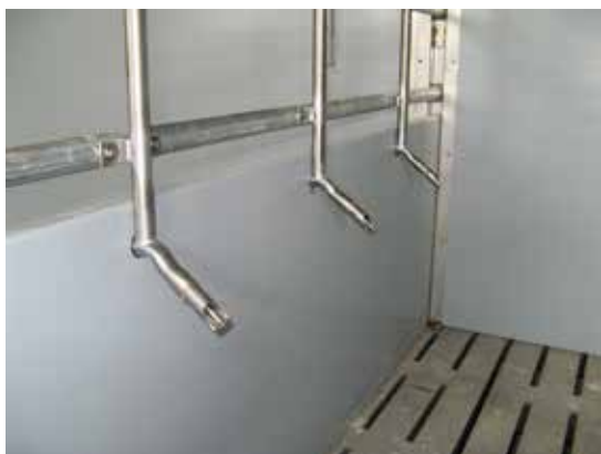
Nippelhalter zur Montage in der Buchtentrennwand