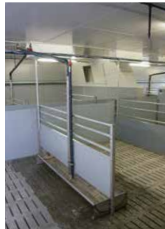
Kurtrog mit Edelstahlablaufrohr und Trogsonde für Sensorfütterung mit Tier : Fressplatzverhältnis 3:1